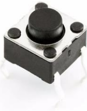
Figura 1: Pushbutton. Os pinos abaixo e a esquerda da figura estão conectados; o pino abaixo e a direita só se conectam quando apertamos o botão.

Atenção: observe a figura abaixo e note que, pela sua descrição, você deverá por exemplo conectar o GND no pino inferior e a porta digital no pino da direita (ou no que não está sendo exibido na figura).