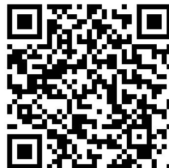
Figura 4: Vídeo do circuito montado pelo professor.

Veja o vídeo do circuito final obtido por seu professor no QR-code abaixo.